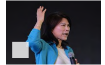
董明珠还能奋力奋战多久? |《至少一个小...