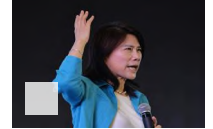
董明珠还能奋力奋战多久? | 《至少一个小...